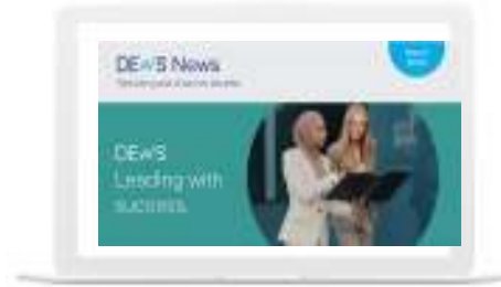
الصحيفة الإلكترونية لنظام مدخرات الموظفين في إمارة دبي