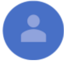
يحدد لاحقاً ممثل دائرة المالية في حكومة دبي