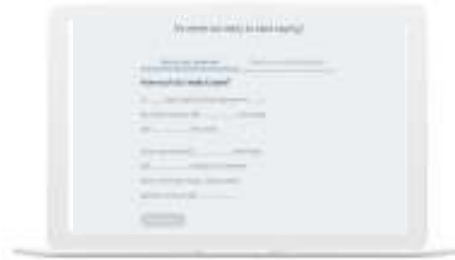
اللآلات الحاسبة والأدوات